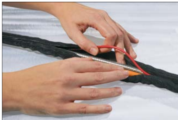
Helagaine Twist-In umożliwia szybki i prosty dostęp do wiązki przewodów w przypadku czynności inspekcyjnych, prac remontowych, czy montażu.