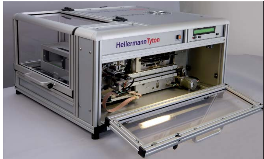
Automat tłoczący M-BOSS do stalowych sztyldów oznaczeniowych.

Opcjonalnie, możemy dostarczać sztyldy M-BOSS luzem w odrębnej torebce do samodzielnego złożenia w kasetach (ponowne wykorzystanie kaset).