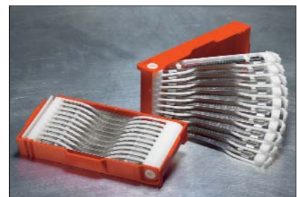
Zastosowanie kaset M-BOSS umożliwia sprawny wybór pojedynczych sztyldów.