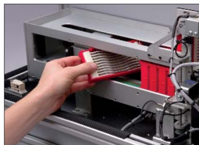
Proste przygotowanie automatu M-BOSS do pracy. Szybkie zakładanie i wyjmowanie kaset.