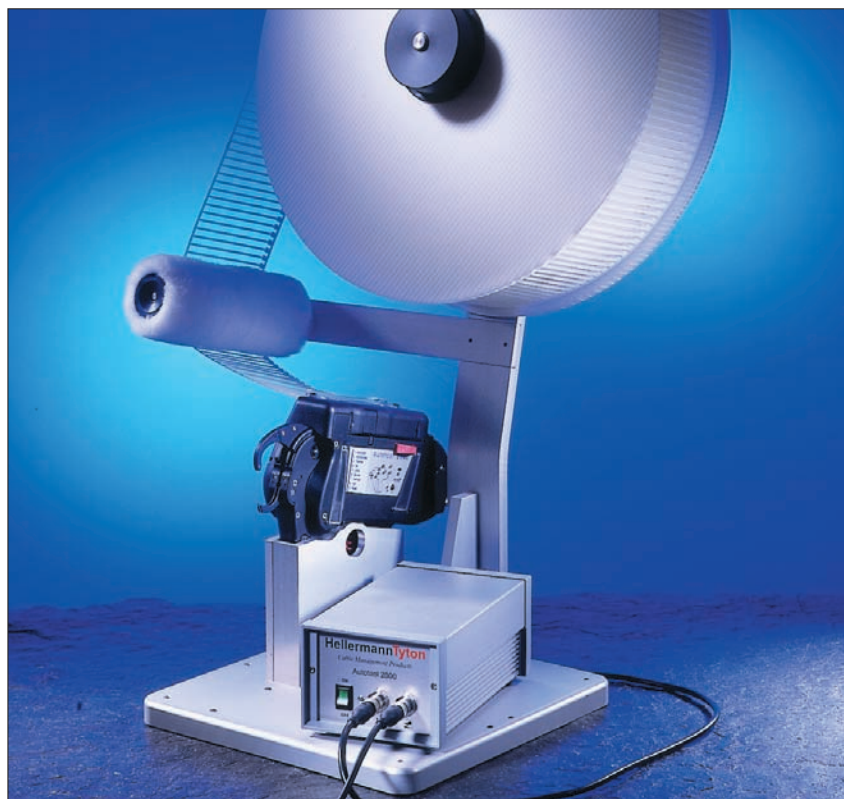
Stanowisko do pracy stacjonarnej. Autotool 2000, zasilacz i szpula.

Dzięki niezawodności, łatwości obsługi i elastyczności zastosowania, Autotool 2000 jest idealnym rozwiązaniem dla wszystkich gałęzi przemysłu, gdzie stosuje się duże ilości opasek. Szczególnie w branżach wymagających jakości wiązania, np. przy konfekcji wiązek przewodów, czy w branży samochodowej, maszynowej i opakowaniowej, Autotool 2000 optymalizuje procesy produkcyjne pod względem czasu i kosztów.