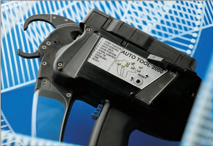
W pełni automatyczne narzędzie do zakładania opasek montażowych.