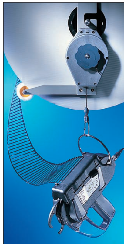
Stanowisko do pracy w podwieszeniu. Widoczna szpula i Autotool 2000.