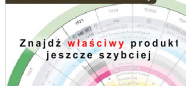
Tabela doboru termokurczy