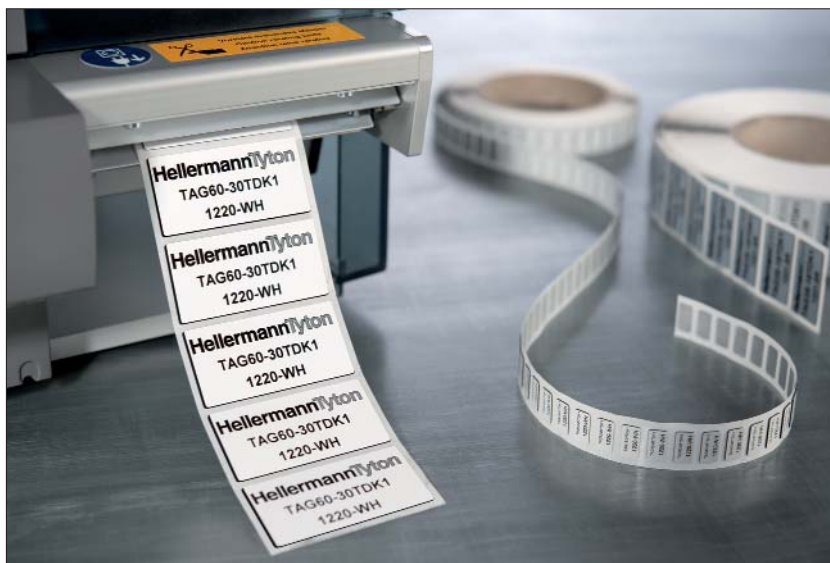
Łatwy nadruk oznaczeń za pomocą systemów drukujących TT4000+ oraz TT430.