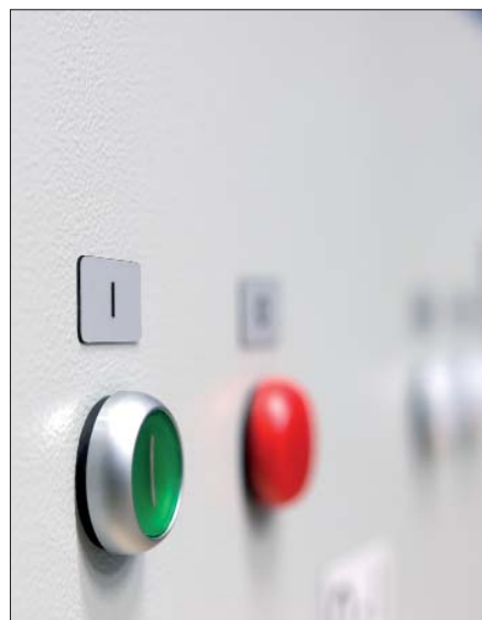
Idealna alternatywa do grawerowanych tabliczek: etykiety panelowe.