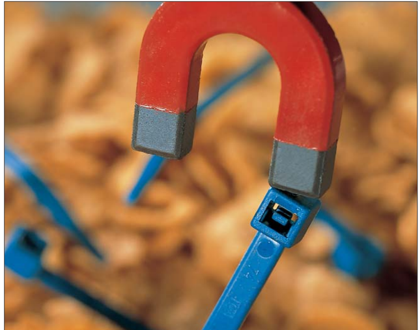
MCT z zawartością pyłu metalowego.

Opaski z dodatkiem metalu zostały specjalnie opracowane do wykorzystania w procesach produkcyjnych w przemyśle farmaceutycznym, chemicznym i spożywczym. Opaska nadaje się znakomicie jako zamknięcie pojemników transportowych i worków. Ponadto stosuje się je w instalacjach przewodów i kabli w maszynach produkcyjnych przeznaczonych dla tych branż.