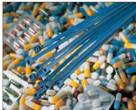
MCT - bezpieczeństwo i produkcja bez zanieczyszczeń.